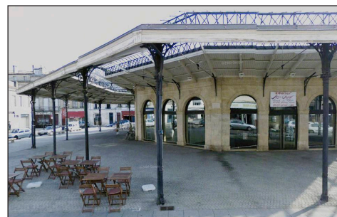
Halles des Chartrons à Bordeaux