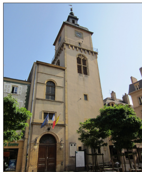
Beffroi de Thionville