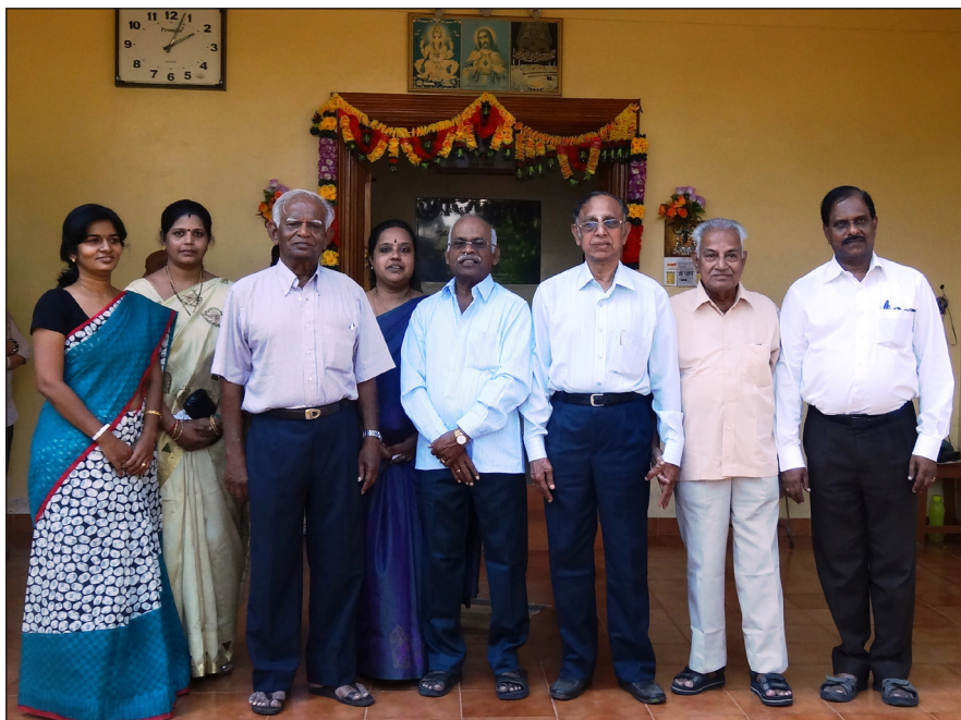
L'ensemble du Comité Directeur

Je suis allé à Pondichéry pour mieux connaître le fonctionnement de l'Atelier, me faire connaître et instaurer une coopération constructive. Je prévoyais de discuter avec les responsables (photo 1) de l'équilibre de nos comptes, de la formation interne des jeunes embauchées, de l'évolution des effectifs de l'Atelier, de l'entretien des locaux, de la santé des brodeuses, de leurs salaires face à l'augmentation des prix induite par l'inflation, des bourses accordées pour que leurs enfants suivent des études, des projets de toiles brodées nouvelles à concevoir par les dessinatrices, des tissus utilisés, du maintien et du développement et de la qualité des broderies, de la programmation de la réalisation des toiles commandées et de l'avenir de l'Atelier.