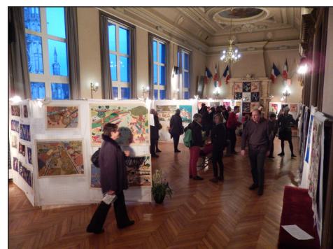
Mairie de Vernon