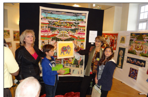
Rueil – Tirage de la tombola