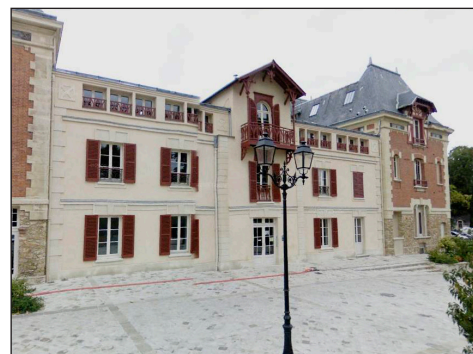
La maison Caillebotte à Yerres