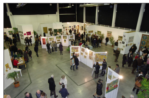
Exposition de Laval