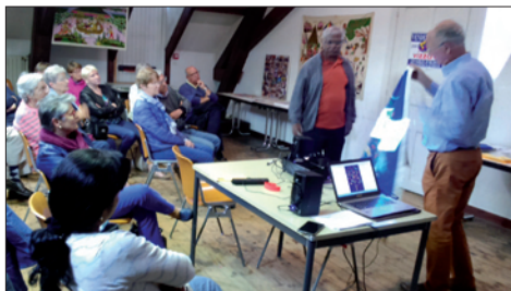
aux Sables d'Olonne