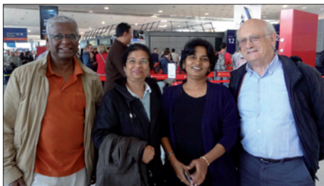
départ à Roissy ... snif ...