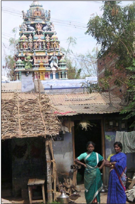
Paillottes et temple

Aujourd'hui, certains de nos visiteurs nous disent qu'avec un développement économique annuel entre 6 et 8 %, dont font état les journalistes, et avec des personnes aussi riches que les Mittal ou les Tata, l'Inde n'a plus besoin de notre aide. Qu'en est-il en réalité ?