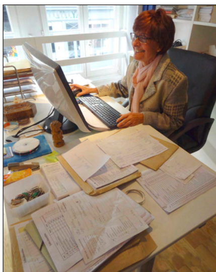
Saisie des commandes

A la suite des expositions, il importe encore de contrôler les commandes de toiles et d'effectuer la mise en banque des paiements des acheteurs. Parallèlement c'est une tâche tout à fait rigoureuse que de saisir sur ordinateur chaque bon de commande (une remarquable application dédiée nous y aide) ce qui permet de répercuter sur l'atelier à Pondichéry les toiles à produire et ensuite d'en préparer les livraisons.