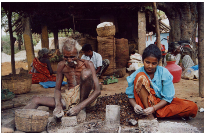
Décorticage de noix

indiens n'a donc pas de W.C., on se contente de latrines, sans chasse d'eau ni fosse septique, vidées et nettoyées manuellement.