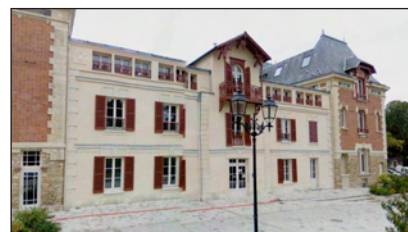
Orangerie de la maison Caillebotte à Yerres

Si vous avez des amis ou de la famille qui pourraient nous aider dans ces villes ou encore organiser une exposition ailleurs, merci de bien vouloir contacter :