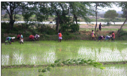
Au bord de la rizière