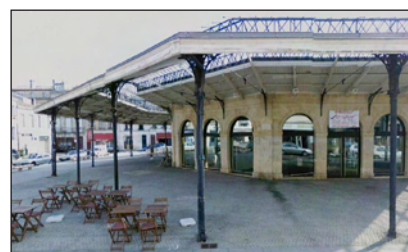
Halles des Chartrons à Bordeaux