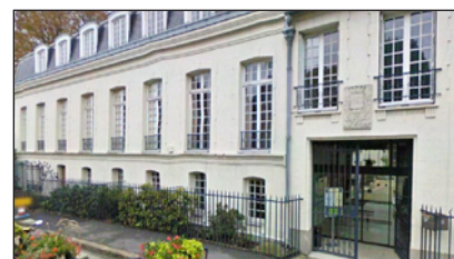
Hôtel de Malestroit à Bry sur Marne