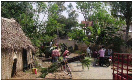
Un vélo chargé