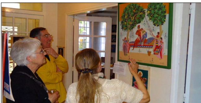
Une exposition privée en appartement

régler tout ça. Les toiles prennent ainsi un relief particulier avec une apothéose en soirée lorsque la lumière extérieure baisse. Avant il aura fallu prendre des contacts, des rendez-vous avec des sponsors éventuellement prêts à nous aider en assumant tout ou partie des frais : locations des locaux, s'ils ne sont pas offerts, impression des tracts et affiches ou encore les frais du cocktail du vernissage car notre objectif est que presque tout l'argent des ventes aille aux brodeuses. Il faut aussi toucher et charmer les médias écrits, radio ou télé pour qu'ils parlent de l'événement. La ville aussi doit être incitée à annoncer l'exposition dans ses publications, son agenda culturel et sur ses panneaux d'affichage et lumineux ; l'Office de Tourisme où il est bon d'expliquer aux hôtesses de quoi il retourne, les Associations locales, l'Association « Accueil des Villes Françaises » qui peut, souvent, apporter