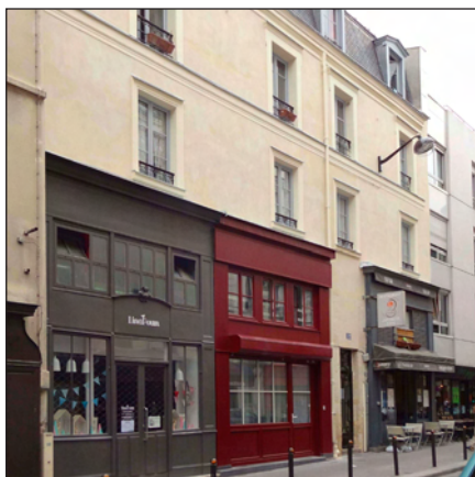
Une boutique rouge dans un immeuble fraîchement ravalé

Pour que les expositions aient lieu sans anicroche et soient des réussites, il y a tout un ensemble de tâches, souvent méconnues, à assumer.