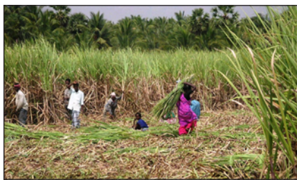
Récolte de la canne à sucre