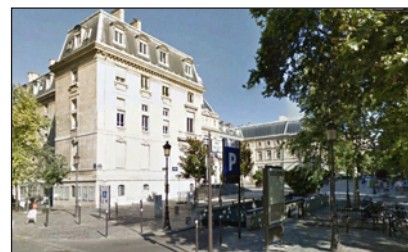
Mairie du XV e à Paris