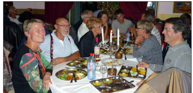
Dîner de fin d'exposition

Les bénévoles reconnaissent que ces efforts sont bien récompensés par la chaleur humaine et les relations exceptionnelles de fraternité toutes simples qui se développent entre eux durant l'exposition. On se sert régulièrement du thé et du café dans les immanquables moments creux. Les échanges autour des souvenirs de ceux qui se sont déjà rendus en Inde sont d'une grande richesse et laissent bien des belles images dans les yeux. En fin d'exposition, toute l'équipe est conviée à un moment convivial important lors d'un dîner partagé où sont