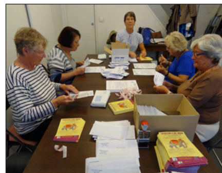
Routage des invitations

Puis c'est la distribution aux acheteurs : dispatching et envoi de paquets de toiles via les responsables d'expos, vérification du bon aboutissement et du règlement des soldes éventuels.