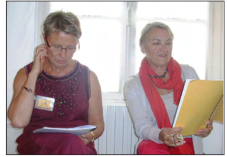
Deux animatrices révisent les explications de toile